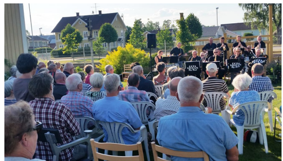
Gota Stream Big Band spelar i Järnvägsparken.

Under hösten 2017 installerade vi fjärrvärme i stugan och byggde in trapphuset till andra våningen. Detta har bidragit till att inomhusklimatet har blivit behagligare och att uppvärmningskostnaderna minskat under 2018. Genom Vaggeryds trädgårdsförenings försorg har en vacker blomsterrabatt prytt Magnisa stugas framsida.