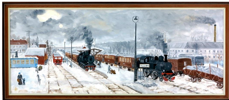
Vaggeryds station omkring 1945.

http://www.platsr.se/platsr/visa/plats/id/477