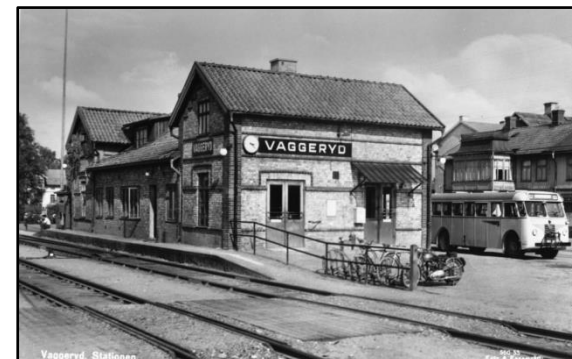
Järnvägsstationen omkring 1955